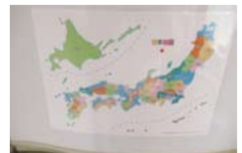
子どもの地図学習